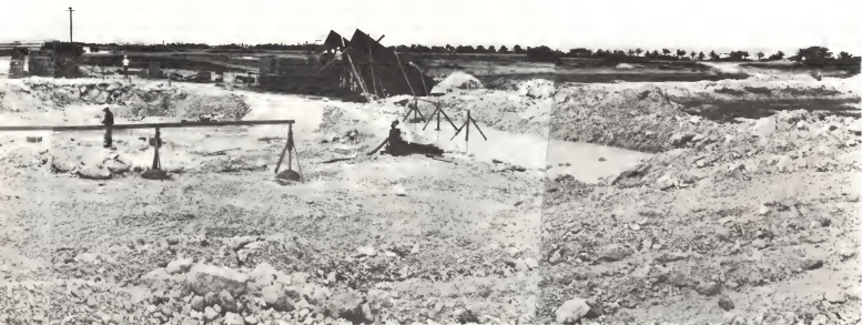
00 hende ta trahando actualmente, tambe ta den full swing.